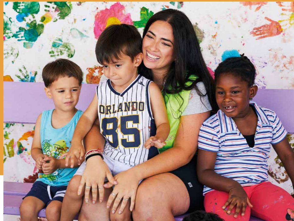
Programa iniciado en el año 2007